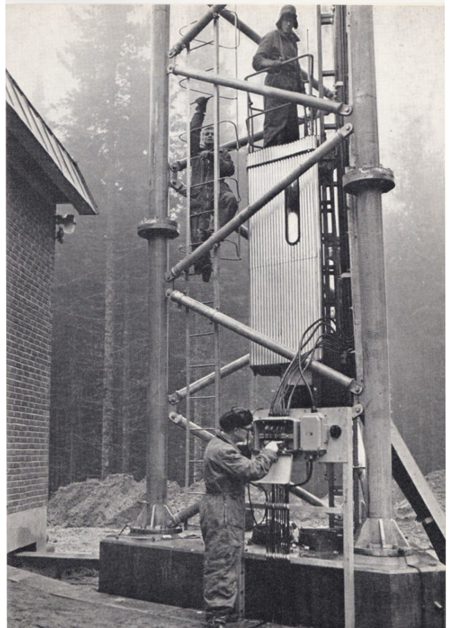
Radio- och Televisionsstationen i Borås/Dalsjöfors togs i bruk under året