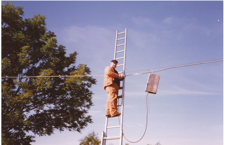
Åke Artursson lagar en blykabel i Gullestorp