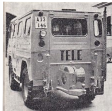
Kabeldragningsjeepen i nytt utförande och med den viktiga förändringen att vinschen kan fjärrmanövreras med kabel